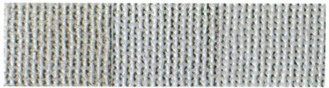
●クロステックスシーラー ●クロステックス1回目 ●クロステックス2回目

艶の調整により、優美な仕上げが得られます。 クロステックスは、ツヤ消、3分ツヤ、ツヤ有の3種類か ら選択できるので、コーディネートすることで、優美な仕 上げが得られます。