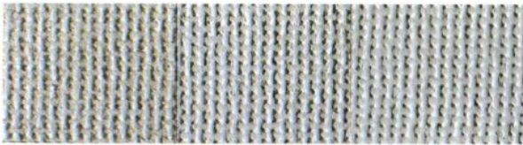
● クロステックスシーラー ● クロステックス 1回目 ● クロステックス 2回目

クロステックスは、ツヤ消、3分ツヤ、ツヤ有の3種類から選択できるので、コーディネートすることで、優美な仕上げが得られます。